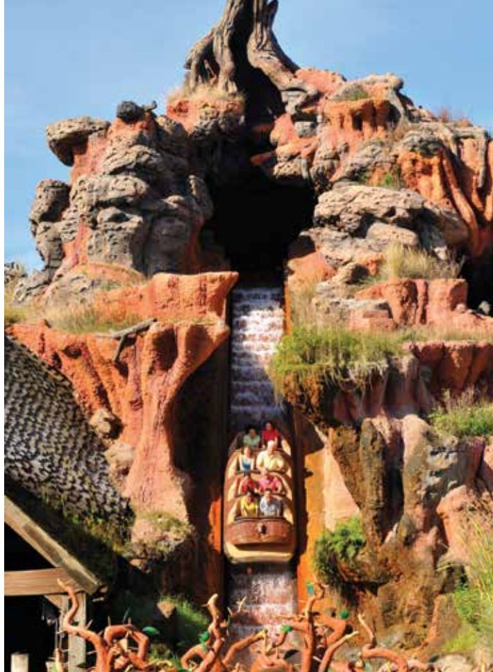
LEFT Splash Mountain.