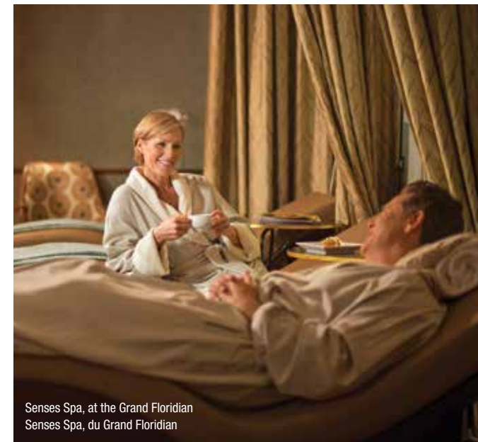
Senses Spa, at the Grand Floridian Senses Spa, du Grand Floridian

Quand on dépasse ces fameux rochers pour atteindre les