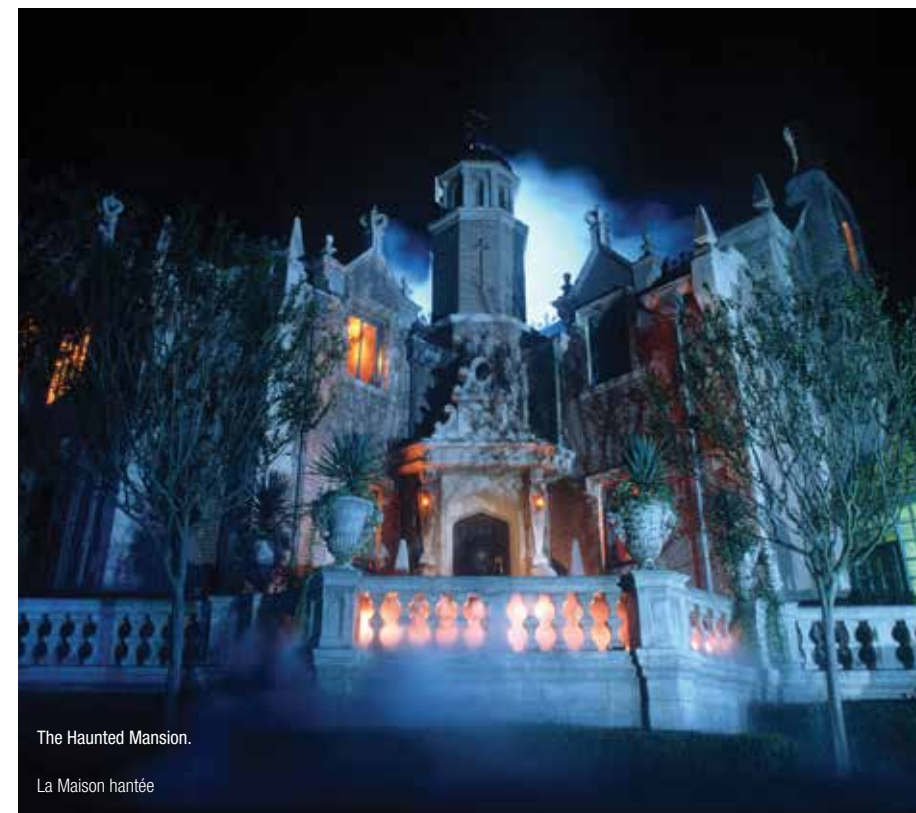
The Haunted Mansion.